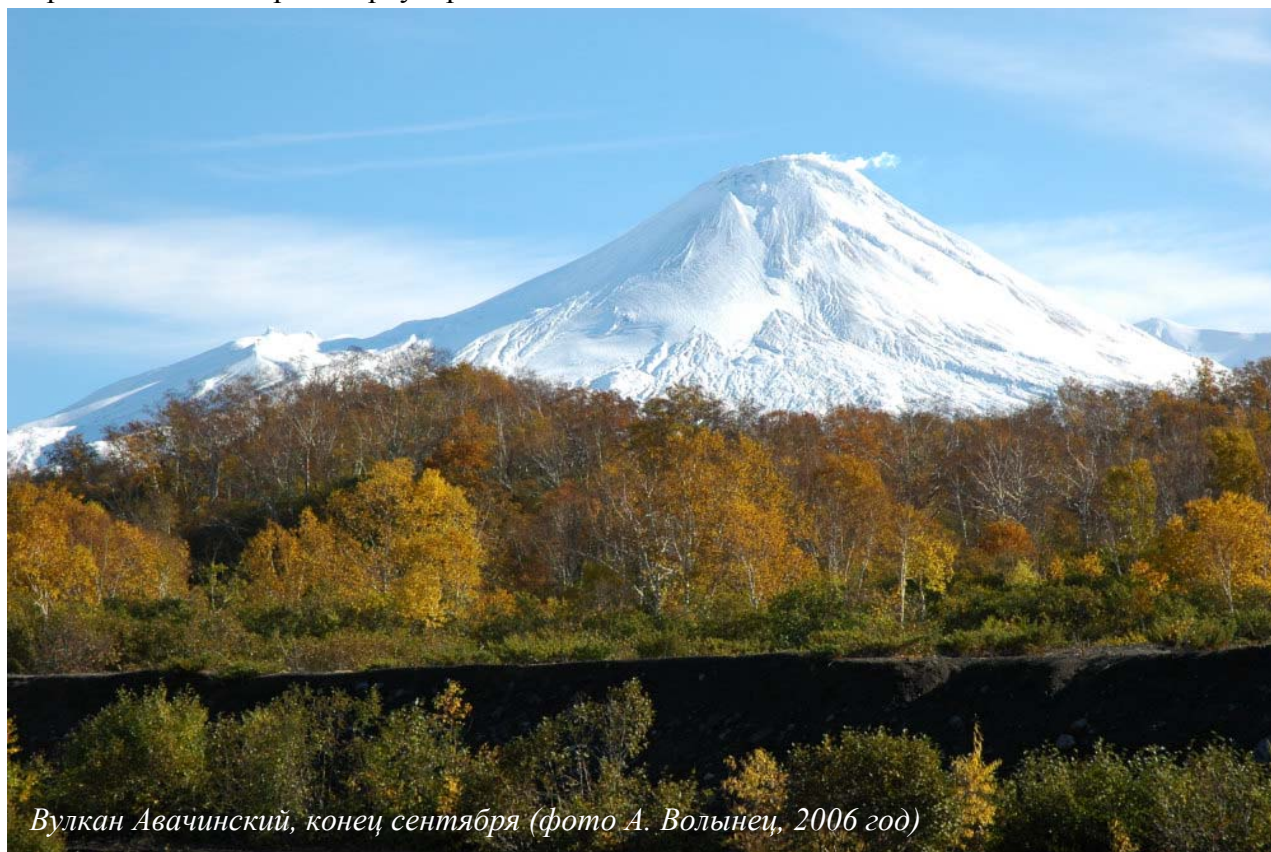
Вулкан Авачинский, конец сентября (фото А. Вольнец, 2006 год)

В рамках конференции предполагается проведение однодневной геологической экскурсии на вулкан Авачинский, либо Горелый, либо Мутновский (в зависимости от погоды) с доставкой группы до подножия вулканов автотранспортом ИВиС и последующей пешей экскурсией. В районе вулканов в конце сентября уже ложится снег, поэтому рекомендуется иметь с собой теплую (зимнюю) одежду для участия в экскурсии. Более подробная информация об экскурсиях будет разослана во втором циркуляре.