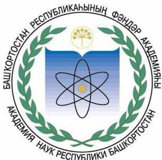
Академия наук республики Башкортостан